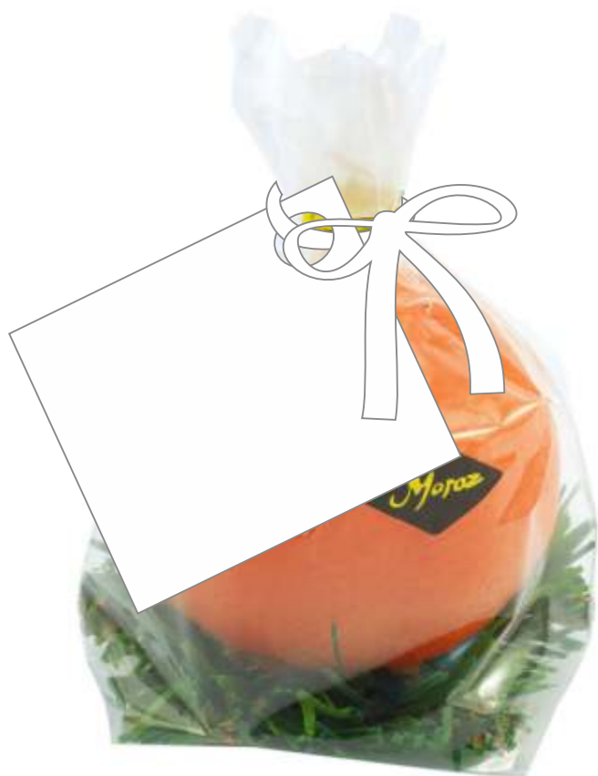
Бирка на свечи